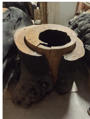
Fernando Alba, Abismos , 1991.

Juanjo Palacios. Sonidos propios. 13 de abril – 18 de junio de 2023. Palacio de Velarde (patio y salas de exposiciones planta baja).