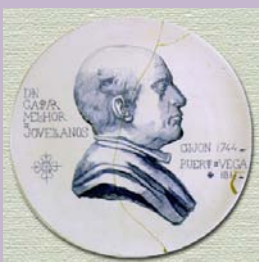
Plato conmemorativo , de la Fábrica de Loza "La Asturiana", de Gijón, c.1891, con el retrato de busto de Jovellanos y perfilado a la derecha, la Cruz de Calatrava.

• Gaspar Melchor de Jovellanos (Gijón, 1744 - Puerto de Veiga, 1811) Uno de los asturianos más célebres y figura clave de la Ilustración española. Cursó estudios de derecho canónico. En 1767 da un giro a su vida y se dedica a la magistratura. Fue escritor, jurista y político ilustrado. Puedes conocer más datos sobre su vida en la web Museo-Casa Natal de Jovellanos, en Gijón ( http://www.jovellanos.net ). La obra que conserva el Museo testimonia el apoyo y amistad de Jovellanos al gran pintor aragonés, Francisco de Goya (Fuendetodos, Zaragoza, 1746 - Burdeos, 1828) en los comienzos de su carrera. Jovellanos es representado de cuerpo entero, con el brazo derecho en jarras sujetando el bastón. En el pecho y prendida a la casaca puede verse el distintivo de la Orden de Alcántara. La marina del fondo puede identificarse con el Arenal de San Lorenzo, próximo al antiguo Gijón. La pose, en actitud heroica, denota una personalidad elegante, noble y distinguida.