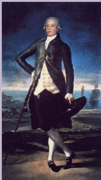
Francisco de Goya, Retrato de Jovellanos , c. 1781

• ¿Y qué tiene todo esto que ver con el Museo? Los pintores y artistas a lo largo de la historia, han reflejado las leyendas, mitos y hazañas de todos estos héroes y heroínas. Pueden aparecer en cuadros que ilustran relatos mitológicos, en los paisajes y pinturas de la naturaleza, de plantas, en los retratos de personajes ilustres, en hechos históricos que fueron decisivos para el transcurso de la historia de la humanidad, etc. Por ello, siempre es muy importante ser un buen observador y fijarse en todos los detalles y pistas que nos da el pintor para que identifiquemos la escena o al personaje al que se refiere.