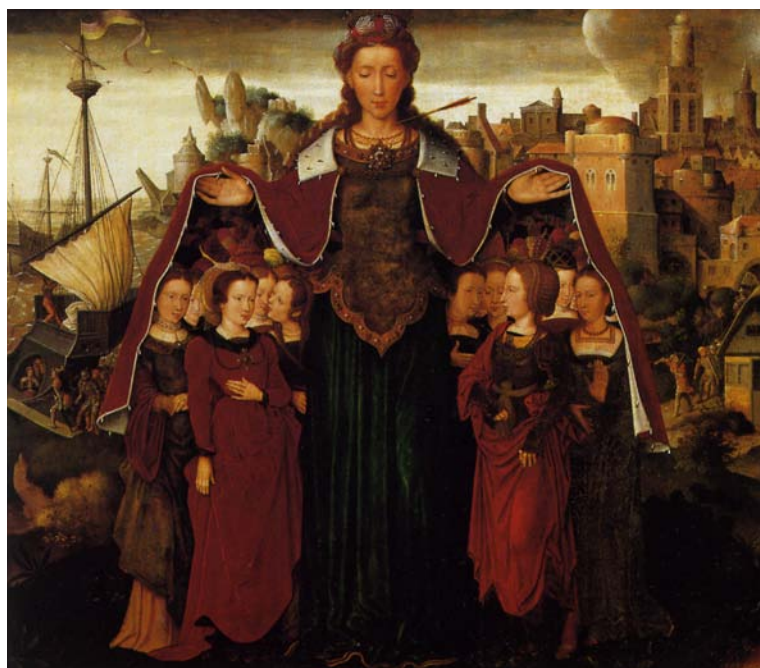
Santa Úrsula con las once mil vírgenes. Pieter Claeissens, el viejo, c. 1560

Investiga y descubre la historia de Santa Úrsula y sus compañeras.