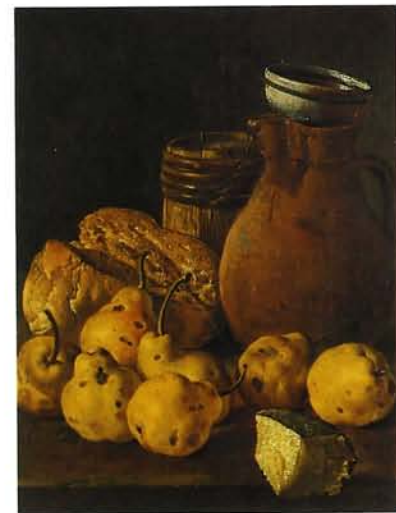
LUIS MELÉNDEZ Bodegón: Pan, peras, queso y recipientes Oviedo. Museo de Bellas Artes de Asturias Depósito del Museo del Prado