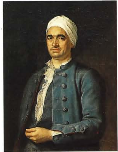
LUIS MELÉNDEZ Retrato de un desconocido Oviedo. Museo de Bellas Artes de Asturias Depósito del Principado de Asturias. (Col. Pedro Masaveu)

11 Escuela barroca madrileña: Escuela pictórica del siglo XVII radicada en Madrid que desde un naturalismo tenebrista evolucionó, por influencia de las escuelas flamenca y veneciana, hacia una pintura grandilocuente, de colorido opulento, composición dinámica y técnica fluida.