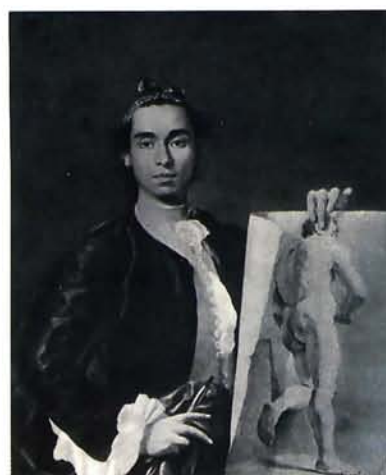
LUIS MELÉNDEZ Autorretrato, 1746. París. Museo del Louvre

A continuación, pasamos a comentar las obras realizadas por Miguel Jacinto, Ana, Luis y José Agustín, que conserva y expone, ahora reunidas, el Museo de Bellas Artes de Asturias.