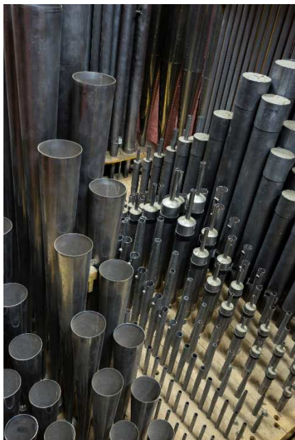
SIASATRU (Órgano, Basilica de Covadonga), 2015

Colección de Arte Contemporáneo Fundación María Cristina Masaveu Peterson