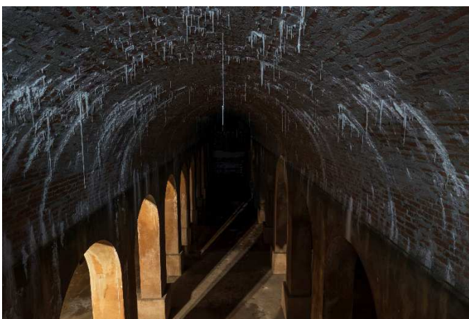
SARISTAU (Depósito de agua de Roces I, Gijón), 2015 Joan Fontcuberta

Colección de Arte Contemporáneo Fundación María Cristina Masaveu Peterson