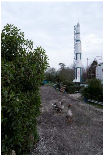
AUSATRIS (Parque de la Vida, La Mata, Luarca), 2015 Joan Fontcuberta

Serie ARSTUSIA. Miradas de Asturias. Mecenazgo. Fundación María Cristina Masaveu Peterson