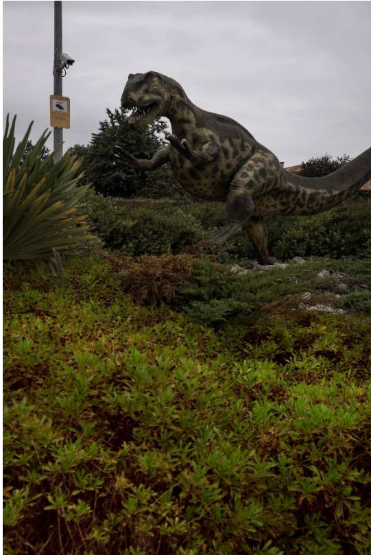
SUTAIRAS (Rotonda, Colunga), 2015