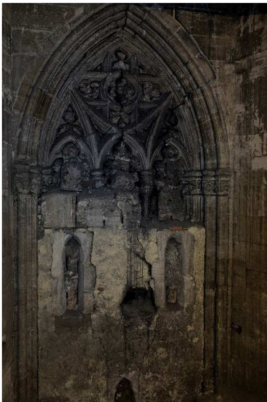
TARIASUS (Ventanal gótico tapiado del Claristorio Bajo de la Capilla Mayor, Catedral de Oviedo), 2015

Colección de Arte Contemporáneo Fundación María Cristina Masaveu Peterson