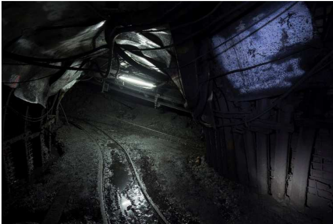
SAURITAS (Mina Carbonar, Vega de Rengos, Cangas del Narcea), 2015 Joan Fontcuberta

Serie ARSTUSIA. Miradas de Asturias. Mecenazgo. Fundación María Cristina Masaveu Peterson