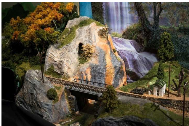
RUTSIASA (Maqueta, Grupo Asturiano de Módulos Ferroviarios H0, Gijón), 2015 Joan Fontcuberta

Colección de Arte Contemporáneo Fundación María Cristina Masaveu Peterson