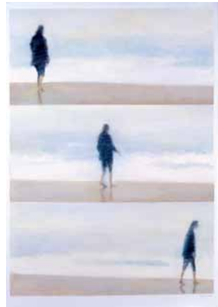
FEDERICO GONZÁLEZ GRANELL, En la playa , 2001.

En este sentido, esta exposición, polifónica, ecléctica, heterogénea y variada en cuanto a sus hebras discursivas, reúne principalmente pintura, dibujo y fotografía realizada en los últimos tiempos, con las que se pretende complementar el discurso dedicado al arte contemporáneo asturiano que puede verse en el edificio de Ampliación del citado centro, en Oviedo. Y en concreto, el consagrado a esas últimas generaciones, pobladas por artistas cultivadores de distintos géneros, registros y estilos, y por lo tanto muy difíciles de homogeneizar, pero que han demostrado reunir una serie de cualidades que permiten, aunque sea de manera general, relacionarlos entre sí. Entre ellas cabe destacar su elevado grado de formación, su interés por entrar en contacto con distintas disciplinas, su fuerte impulso experimentador y un