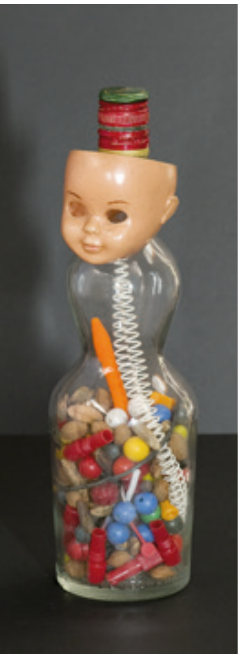
(Sin título), 1988. Vidrio, plásticos, etc. Alto 30 x Ø 9 cm (Sin título), anterior a 1958. Madera de castaño y cera. 34,3 x 8 x 6,5 cm