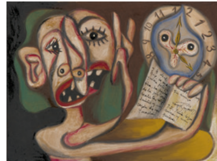
CRONO PICTÓRICO, 1934 Gouache y tinta china sobre papel. 350 x 470 mm