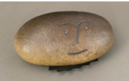
(Sin título), anterior a 1958. Hierro. 11,5 x 14 x 5,3 cm Caja para lápices. (Sin título), 1940. Madera, óleo y tinta. 23 x 8,2 x 4,4 cm (Sin título), c. 1960. Piedra y goma. Alto 10,5 x largo 22 cm