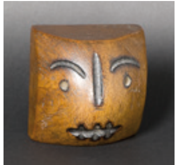
(Sin título), anterior a 1958. Madera y óleo. 27,8 x 17,2 x 5,8 cm (Sin título), anterior a 1958. Madera de castaño y cera. 9,7 x 9,3 x 7,1 cm