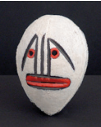
(Sin título), posterior a 1960. Corteza de coco y óleo. 14,2 x 10,1 x 4,4 cm