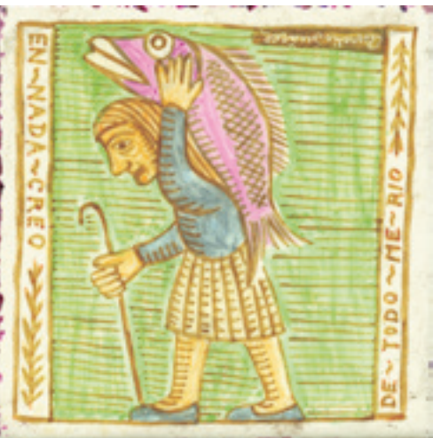
Obras de Julio Verne. Cubiertas. (Sin título), 1988. Lápiz sobre papel. 27,3 x 17,5 x 1,1 cm (Sin título), 1986. Madera, vidrios, plásticos, etc. 30 x 25,2 x 5,4 cm Azulejo. (Sin título), c. 1947. Ladrillo vidriado. 10 x 10 x 1 cm