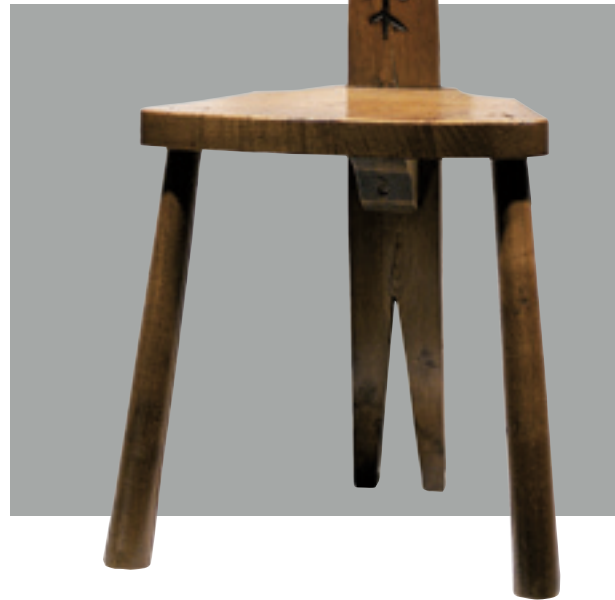
(Sin título), c. 1960 Madera de castaño con incisiones por hierro candente y cera. 90 x 43 x 31 cm