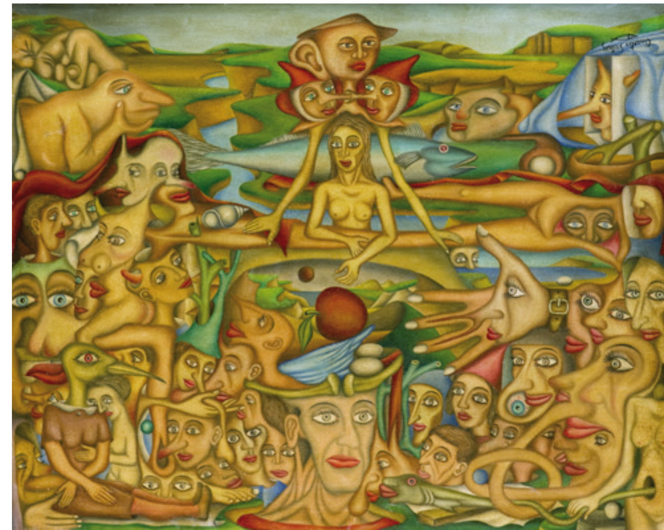
MUNDO OCULTO, 1946. Óleo sobre lienzo. 73 x 92 cm

Por otra parte, todo el conjunto de piezas documentales, artísticas y objetuales integradas en la donación y en el depósito se encuentran en la actualidad en fase de inventariado, fotografiado y catalogación para la posterior puesta a disposición de todo este “universo aureliano” a investigadores y público en general.