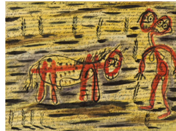
TEOREMA PICTÓRICO, 1932 Gouache y tinta china sobre papel. 350 x 470 mm