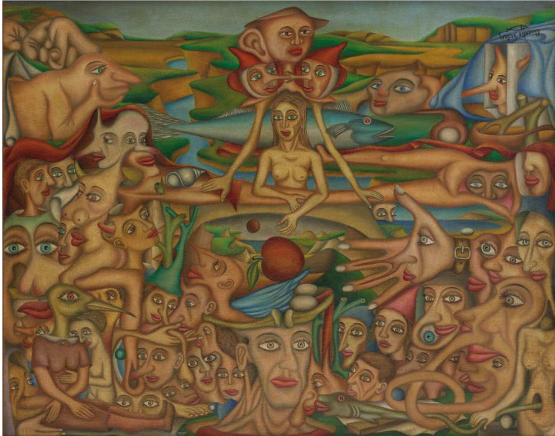
AURELIO SUÁREZ (Gijón, 1910 — 2003), Mundo oculto , 1946. Óleo sobre lienzo, 73 x 92 cm. Depósito Familia de Aurelio Suárez.