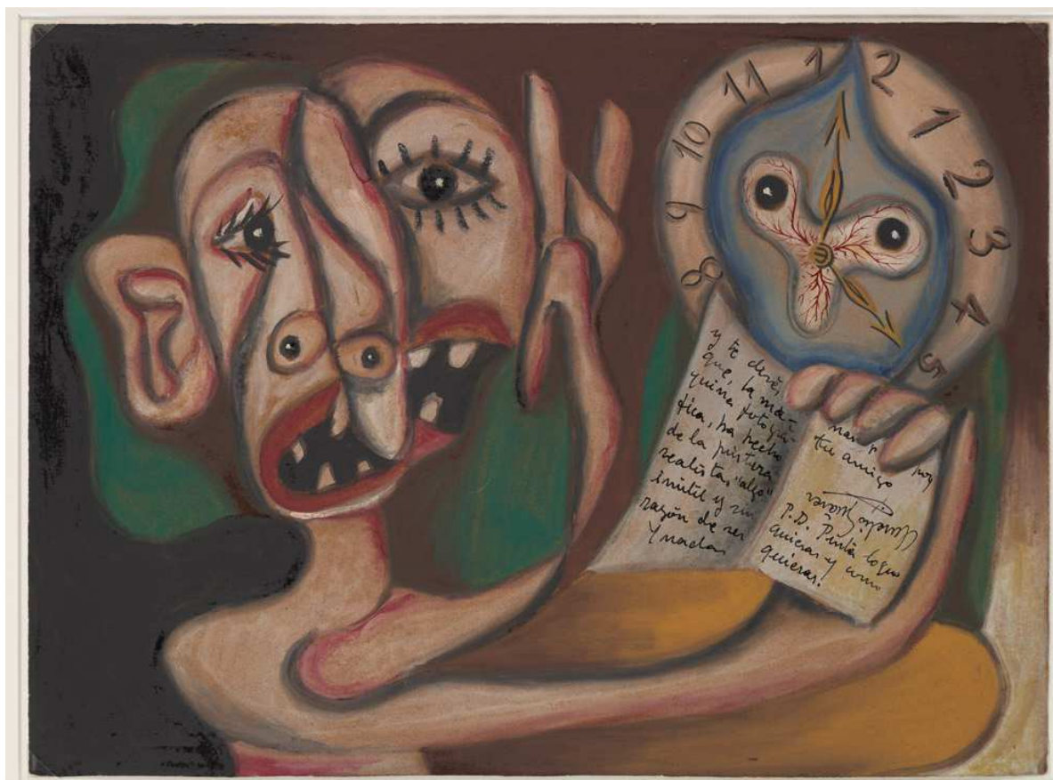
AURELIO SUÁREZ (Gijón, 1910 — 2003), Crono pictórico , 1934. Gouache sobre papel, 350 x 470 mm. Depósito Familia de Aurelio Suárez.