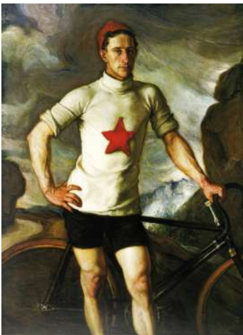
Nicolás Soria El Campeón , 1910. Colección Familia Soria, Avilés

El Museo de Bellas Artes de Asturias conserva y presenta la colección pública más completa de arte regional y procura, desde su fundación en 1980, la difusión de nuestros artistas, a través de la adquisición de obras y de la programación de exposiciones, publicaciones, conferencias, talleres y otras actividades. Además de la preparación de muestras monográficas y de conjunto también se procura su inserción en el Programa La Obra Invitada, que añade a los autores del circuito nacional e internacional otros del panorama asturiano a través de piezas de contrastada calidad e interés, como es el caso de Nicolás Soria, notable pintor que desempeñó una importante actividad en el primer tercio del siglo pasado y que pertenece a una saga de artistas avilesinos.