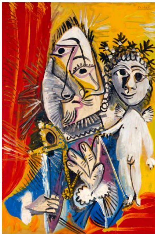
Pablo Picasso. Mousquetaire à l'épée et amour , 1969. Museo de Bellas Artes de Asturias. Colección Pedro Masaveu.

Desde el pasado 15 de julio se encuentra instalada en la primera planta del Edificio Ampliación (sala 23) la exposición Picasso, Braque, Gris, Blanchard, Miró y Dalí. Grandes Figuras de la Vanguardia. Colección Masaveu y Colección Pedro Masaveu , organizada en colaboración con la Fundación María Cristina Masaveu Peterson y la Corporación Masaveu. Esta muestra, que se expondrá hasta el próximo 6 de enero de 2019, reúne un total de ocho obras realizadas por algunos de los más importantes representantes de las vanguardias históricas del siglo XX, así como del arte contemporáneo en general. Cuatro de ellas pertenecen a la Colección Masaveu, que es propiedad de la Corporación Masaveu y está gestionada desde el año 2013 por la Fundación María Cristina Masaveu Peterson, y las restantes a la Colección Pedro Masaveu, la cual, a la muerte de este último en 1993, pasó por dación al Principado de Asturias, quedando desde 2011 definitivamente adscrita a su Museo de Bellas Artes.