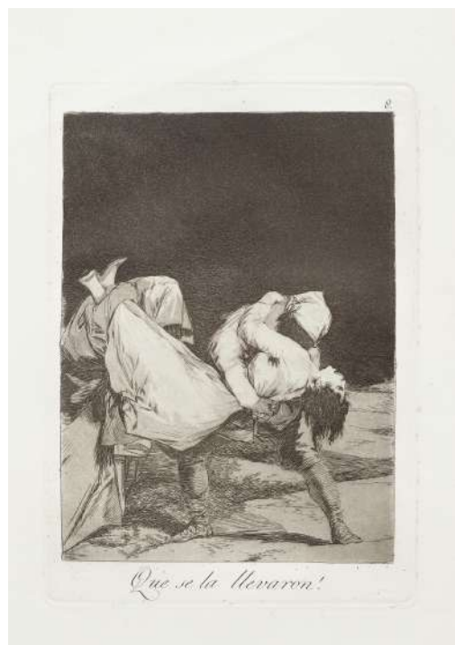
Francisco de Goya y Lucientes. Que se la llevaron! , serie Los Caprichos (1868)

Desde las críticas y populares imágenes de los Caprichos y los Disparates hasta las más raras y singulares estampas de viajes y sus obras finales, pasando por las tempranas copias de Velázquez, la selección de grabados que conforman esta muestra invitan al espectador a adentrarse en el apasionante mundo creativo de este gran artista, y a contemplar su evolución como uno de los mejores y más relevantes grabadores de todos los tiempos.