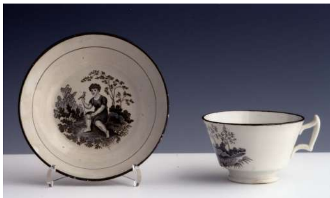
Juego de té (incompleto) estampado y fileteado en negro. Adquisición, 2004.

La exposición Artes Industriales y decorativas: las colecciones del Museo de Bellas Artes (I) reunirá algunas de las piezas más representativas en una muestra que se desarrollará entre los meses de octubre del 2018 y febrero de 2019 en las salas 15 y 16 de la Casa de Oviedo-Portal.