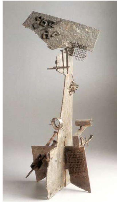
Pablo Serrano. Hierros encontrados y soldados: Quijote , 1957. IAACC Pablo Serrano.

En dicha conferencia se ahondará en la figura y trabajo de Pablo Serrano, una de las voces más importantes de la escultura española de mediados del siglo XX. Tras sus primeros pasos formativos en Aragón, se instaló en América del Sur y regresó a España ya en la década de los años cincuenta para participar en la renovación de las artes plásticas nacionales que tuvo lugar en ese período. Así, secundó el Manifiesto del Grupo El Paso (1957), del que fue fundador, y se integró en el circuito expositivo internacional junto a una pléyade de pintores abstractos.