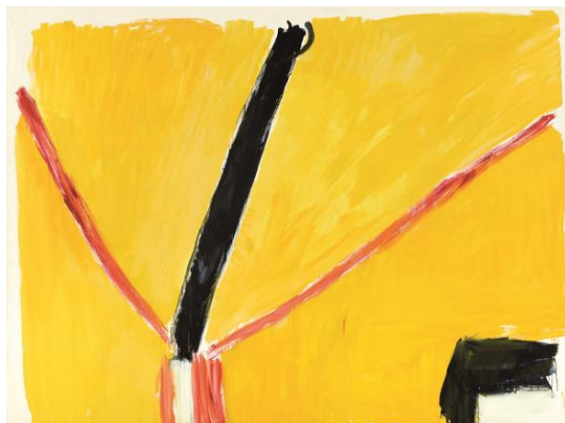
José Guerrero. La brecha III , 1989. Técnica mixta sobre papel. 195 x 260 cm.

La selección de obras de la exposición, que consta de más de 60 piezas procedentes de cerca de una veintena de museos y colecciones, muestra las carreras paralelas de Guerrero y Vicente centrándose en tres momentos señalados de un recorrido compartido: una primera fase figurativa con paisajes urbanos y rurales, una segunda en la década de los cincuenta en donde ambos creadores se meten de lleno en la abstracción y, finalmente, una tercera fase en los años setenta en la que fueron destilando una voz característicamente propia, que alcanzó en esos años su plena madurez, llevando a diferentes modos de asumir la pintura de los campos de color.