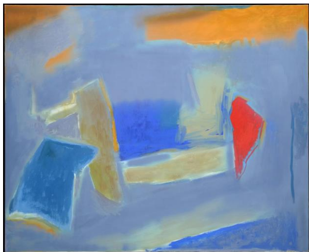
Esteban Vicente. Nuance , 1990. Óleo sobre lienzo. 132 x 162,5 cm

Esta propuesta expositiva busca poner de manifiesto las similitudes y las diferencias, entre dos artistas que, tradicionalmente, la historiografía ha tratado siempre individualmente y por separado, dada la férrea personalidad artística y estilística de ambos.