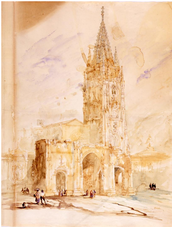
Genaro Pérez Villamil, La Catedral de Oviedo (1837)