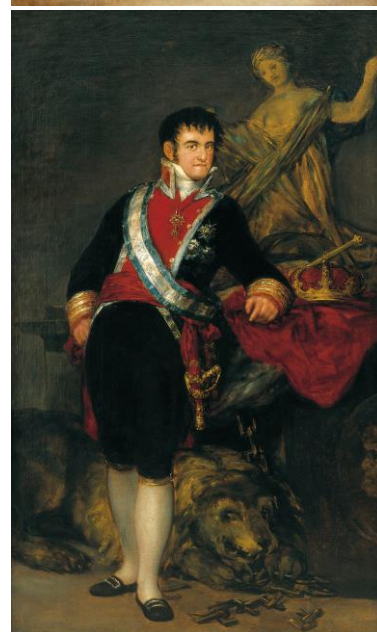
Francisco de Goya, Retrato de Jovellanos en el Arenal de San Lorenzo (h. 1782). Museo de Bellas Artes de Asturias, y Retrato de Fernando VII (1814), Museo de Arte Moderno y Contemporáneo de Santander y Cantabria.