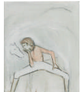
Breza Cecchini, Suspendidos , 2024. Óleo sobre lienzo, 46 x 38 cm.

Palacio de Velarde (patio y salas de exposiciones planta baja).