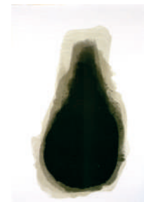
Bernardo Sanjurjo, Lágrima negra , 2004. Serigrafía sobre papel, 1120 x 760 mm.