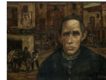
José Gutiérrez Solana, El cura de pueblo , 1923. Óleo sobre lienzo, 70 x 86,5 cm.

Grabado contemporáneo asturiano en las colecciones del Museo de Bellas Artes de Asturias.