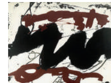
Raig i negre 2, 1985. Colección particular.

Amador en el Museo de Bellas Artes de Asturias: esculturas, maquetas, pinturas, collages, dibujos y medallas.