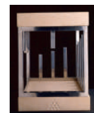
Tetrakys, c. 1972.

Signe i matèria, 1961, de Antoni Tàpies.