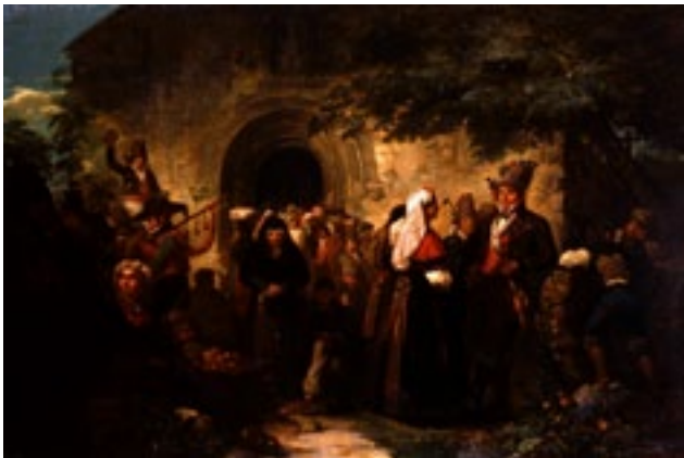
Dionisio Fierros Salida de misa en los alrededores de Santiago de Compostela , 1862 Museo de Bellas Artes de Asturias

Escucha las piezas musicales y relaciónalas con la obra adecuada