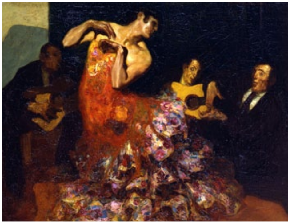
Audición, Serenata Española. Joaquim Malats

¿Ves movimiento en esta obra? ¿Qué hace el artista para transmitirnos esa sensación? ¿Qué instrumentos aparecen en ella?