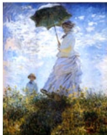
Claude Monet El paseo (Madame Monet e hijo) , 1875 National Gallery (Washington)

Pieza A, Charles Debussy, El paseo . Pieza B, Muñeira, Salida de misa . Pieza C, Concierto de Flauta, Baco .