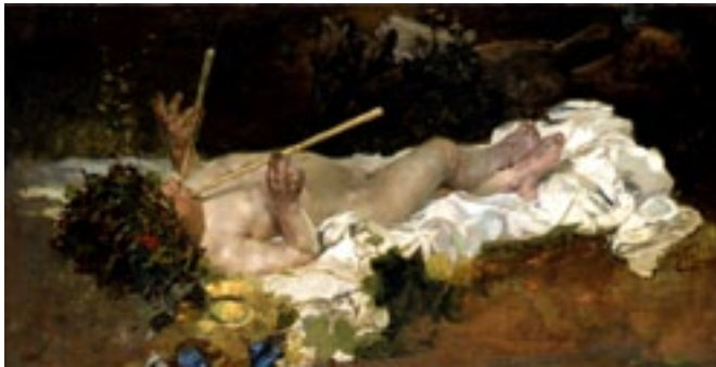
Ignacio Pinazo Baco niño , 1879 Museo de Bellas Artes de Asturias

• Arte y música. La relación entre las diferentes manifestaciones artísticas siempre ha estado presente. En esta ocasión analizaremos la existente entre la pintura y la música. Esta relación puede manifestarse en las obras de arte y las partituras de varias maneras: a través de la representación de instrumentos o porque el pintor se haya inspirado en alguna composición musical.