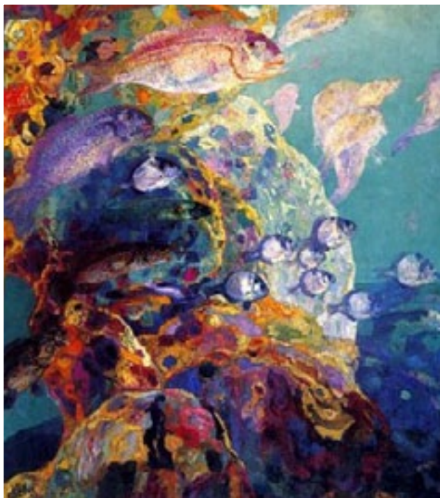
Hermen Anglada-Camarasa , Gruta en el fondo del mar , c.1925 Museo de Bellas Artes de Asturias

Observa la obra de Anglada Camarasa y escucha la pieza musical, descubrirás “como se ve” y también “como suena” el brillo.