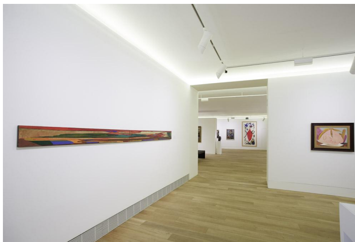
Sala de Luis Fernández, con la anamorfosis a la izquierda. Museo de Bellas Artes de Asturias.

Aunque la anamorfosis suele ser concebida como un simple artificio pictórico, su auge durante el Manierismo significó la expresión más acabada de un cambio epistemológico sin precedentes. En la contemplación de las anamorfosis es reconocible la figuración del nacimiento de un pensamiento perspectivo y relativista acorde con el triunfo de la teoría copernicana. Pero su aparición estuvo también estrechamente vinculada con otra revolución, geométrica esta vez, cuando Desargues inventó la geometría proyectiva codificando las investigaciones perspectivas que los artistas habían realizado de forma práctica e intuitiva durante el Renacimiento. Relegada al olvido durante varios siglos, con el surgimiento a finales del siglo XX de nuevas geometrías no euclidianas, esta perspectiva dislocada volvería a despertar el interés de artistas y poetas deseosos de expresar una forma distinta de ver y concebir el mundo. En la anamorfosis converge pues el arte y la ciencia, la ilusión y la verdad, la belleza plástica y el rigor matemático. De Holbein a Luis Fernández, de Shakespeare a Cocteau, de Galileo a Poincaré, la anamorfosis nos incita a desplazarnos, a desviar la mirada de los caminos trillados para traducir aquello que parece absurdo, feo y aberrante en auténtica poesía.