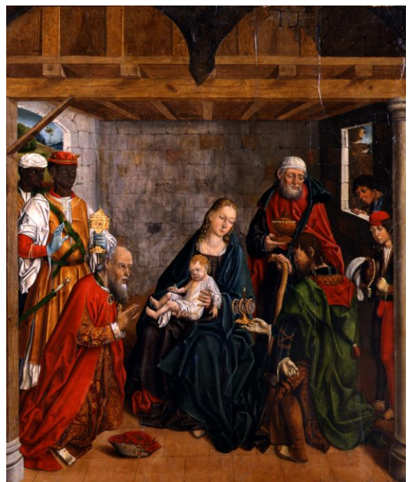
Fernando Gallego, Adoración de los Reyes Magos , c. 1490-1500. Gobierno del Principado de Asturias, Colección Pedro Masaveu

Con la incorporación de la colección pictórica de Pedro Masaveu al Patrimonio del Principado de Asturias y su depósito en el Museo de Bellas Artes de Asturias, esta institución cuenta entre sus fondos con una amplia y variada representación de obras de primitivos españoles. Por su número y su calidad destacan las pertenecientes a la corona de Castilla. Debido a ello, el espacio que se les dedicará en la conferencia será mayor que el que se conceda a las pertenecientes a la corona de Aragón. Entre las obras que se hicieron en tierras castellanas en tiempos de Isabel la Católica, destaca la Adoración de los Magos que Fernando Gallego hizo para el gran retablo de la catedral de Zamora o el Retablo de Santa Marina del Maestro de Palanquinos. A ellas se suma la Asunción y Coronación de la Virgen de Pedro Berruguete, el pintor con el que se inicia el Renacimiento en Castilla. Por su parte, entre las que se llevaron a cabo en la corona de Aragón existe representación de obras de todos sus reinos, a excepción del de Valencia. Digno de destacar es el pintor aragonés Martín Bernat con su Crucifixión . A él se suman La Virgen y santos del pintor mallorquín Rafael Moguer, La Virgen con el Niño atribuida al pintor catalán Ramón Solá y San Pedro liberado por un ángel de Rafael Vergós, asimismo catalán.