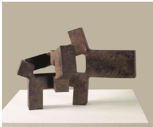
Alrededor del vacío I , 1964, de Eduardo Chillida. Museo de Bellas Artes de Bilbao

El Programa La Obra invitada tiene como misión traer al Museo de Bellas Artes de Asturias durante un periodo de tres meses destacadas obras procedentes de coleccionistas particulares o de otras instituciones nacionales e internacionales que contribuyan a reforzar el discurso de la colección permanente, bien porque permitan profundizar en aspectos ya contemplados por la colección, bien porque permitan cubrir lagunas que en ella puedan detectarse. En esta ocasión, la Obra invitada será Alrededor del vacío I , 1964, de Eduardo Chillida, una escultura procedente del Museo de Bellas Artes de Bilbao.