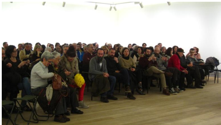
Público asistente a una conferencia en el Museo de Bellas Artes de Asturias

La arquitectura asturiana vivió con gran originalidad y vivacidad el período de recuperación de la arquitectura moderna después de la década de los años cuarenta y de la fracasada restauración oficial de una arquitectura "tradicional y española". Puede decirse que fue obra de profesionales puros, en el sentido de que estaban alejados tanto de los centros principales de poder y de promoción como de las Escuelas de Arquitectura y de las posiciones más intelectuales, lo que les distanciaba bastante del ejercicio común a los profesionales luego más conocidos de Madrid y también de Barcelona. Estas características, y las ligaduras con la cultura arquitectónica internacional que puedan leerse en sus obras completarán la visión del análisis que se promete.