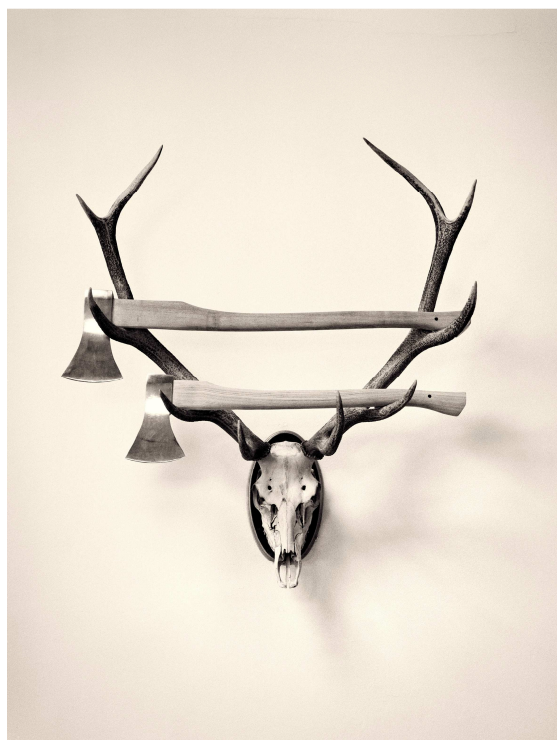
Chema Madoz. Serie El viajero inmóvil , 2016. Miradas de Asturias . Mecenazgo. Fundación María Cristina Masaveu Peterson, 2017. Colección de Arte Fundación María Cristina Masaveu Peterson.

Mirar Asturias requiere, desde la perspectiva y los modos de hacer de Madoz, convertir la realidad de su espacio geográfico, sus costumbres y sus gentes, en una abstracción. Para ello nos propone un viaje inmóvil, pues para la realización del trabajo no necesita desplazarse al lugar concreto, ni obtener imágenes de la realidad cotidiana. Se trata de viajar por la imaginación para descubrir los elementos conceptuales que conforman la idea de una Asturias de la mente. Así, utilizando la capacidad de síntesis de la representación icónica, nos acerca al paisaje y a la naturaleza salvaje, al