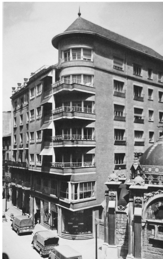
Juan Vallaure, Edificio de viviendas en Melquíades Álvarez, 10, Oviedo, 1952.

En ella se analizará la trayectoria profesional de Vallaure, profundizando en la obra construida en la capital asturiana entre los años 1952 y 1967, por ser la más numerosa e interesante y por ejemplificar, de forma excepcional, la apuesta por la modernidad que tan bien caracterizó este periodo de la historia.