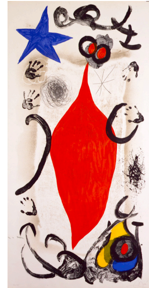
La Grande Écaillère , 1975

(Barcelona, 1893-Palma de Mallorca, 1983)