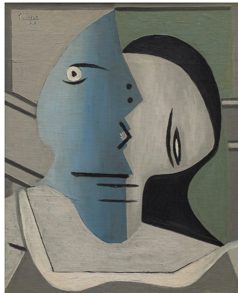
Tête (Personnage) , 1926

Óleo sobre lienzo 41 x 33 cm Colección Masaveu