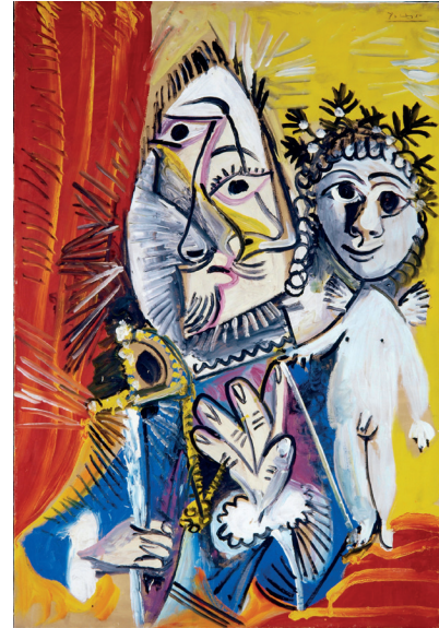
Mousquetaire à l'épée et amour , 1969