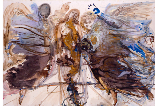
Metamorfosis de ángeles en mariposa , 1973

Acuarela y gouache sobre papel pegado a lienzo