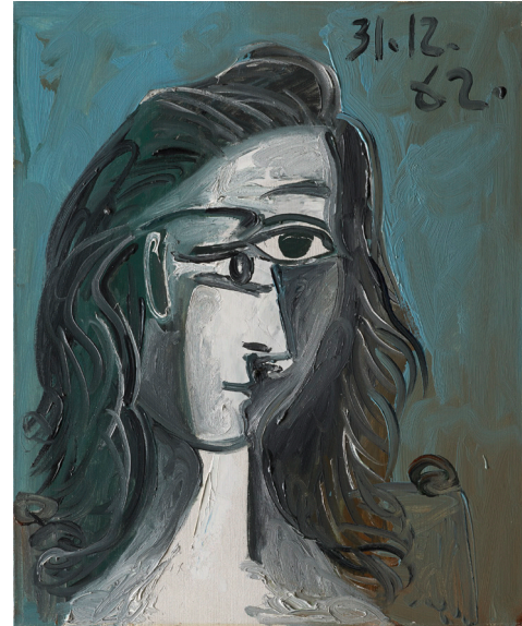
Tête de femme (Jacqueline) , 1962

Óleo sobre lienzo 60 x 50 cm Colección Masaveu