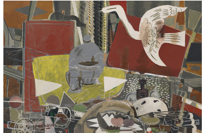
Atelier VIII , 1954-1955

(Argenteuil-sur-Seine, Francia, 1882-París, 1963)