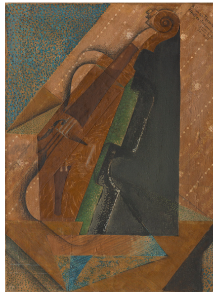
Le violon , 1914

(Madrid, 1887-Boulogne-sur-Seine, Francia, 1927)