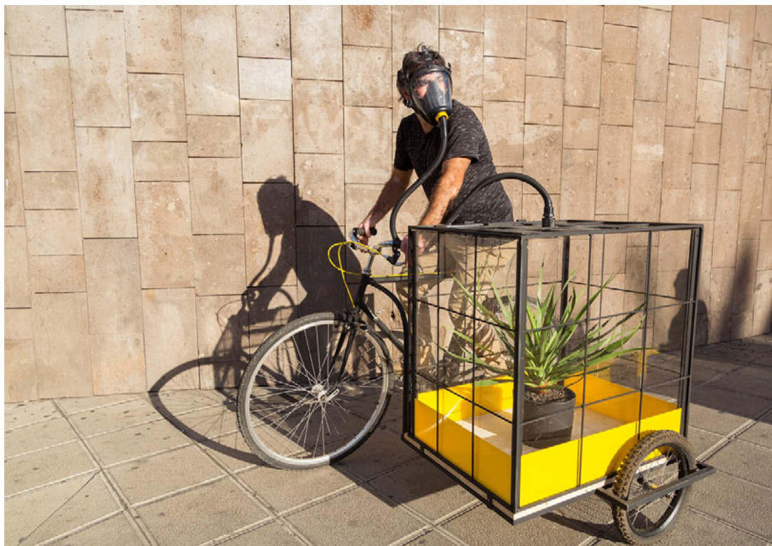
Intervención móvil "Derivas babilónicas"