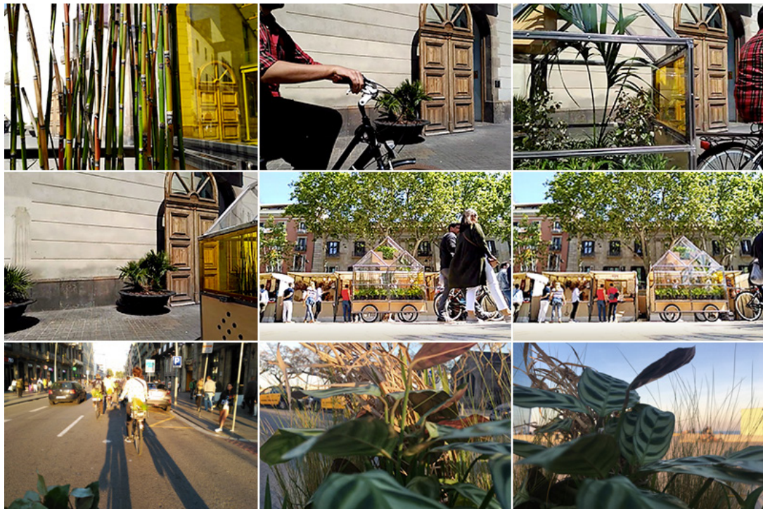
Intervención móvil "Derivas babilónicas"