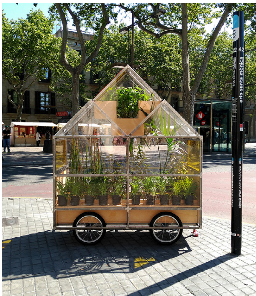
Intervención móvil “Derivas babilónicas”

Esta actividad cuenta con la colaboración de “Materia Botánica” y “Asturies con Bici”.