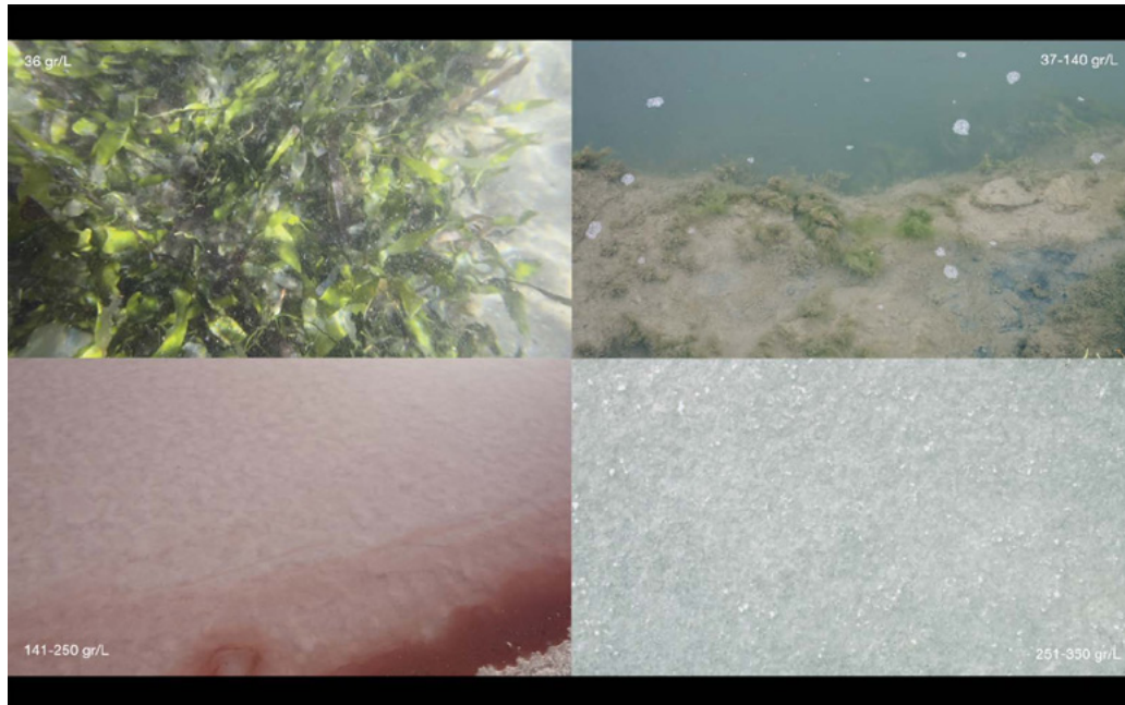
Captura Proyección audiovisual