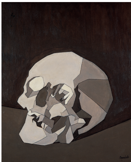
Luis Fernández Crâne , 1958 Colección Telefónica

La Colección Telefónica se compone de un conjunto de más de 1.000 obras entre pintura, escultura, fotografía y obra en papel. La creación de este fondo se inicia en los años 80 con la intención de promover el reconocimiento de una serie de artistas españoles poco representados en los museos estatales. Se adquirieron entonces obras excepcionales de Juan Gris, Tàpies, Chillida, Picasso y Luis Fernández y a lo largo de las dos décadas siguientes, y con objetivos muy distintos al inicial, la Colección se va ampliando y abriendo a otros caminos artísticos.